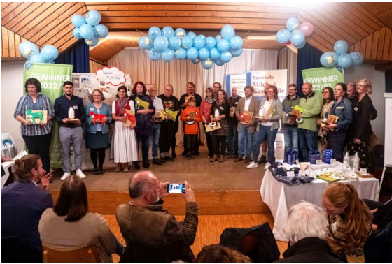
Preisverleihung auf dem Dottenfelderhof am 15.10.2022 in Bad Vilbel