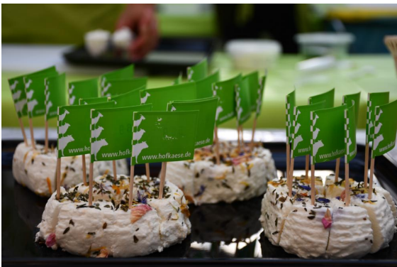
Milch- und Käseprüfung des VHM vom 2. - 4. September auf dem Deutschen Käsemarkt in Nieheim