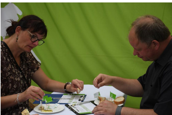
Beliebtheitsprüfung durch das Publikum vom 2. - 4. September auf dem Deutschen Käsemarkt in Nieheim