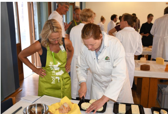
Qualitätsprüfung für den Milch- und Käsepreis vom 2. - 4. September auf dem Deutschen Käsemarkt in Nieheim